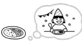
保育園の誕生会を思い出す