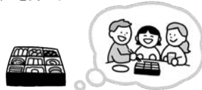
家族で過ごしたお正月を思い出す