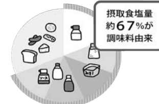
厚生労働省 令和元年 国民健康・栄養調査より作成

日本人が摂取している塩分のうち、調味料由来が67%となっています。減塩するには、「調理に使う調味料」、また「料理にかける食卓調味料」を減らすことが有効です。子どもが好きなマヨネーズ、ドレッシング、ケチャップ、ソースの使い過ぎには注意しましょう。