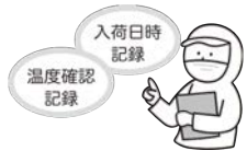
安全な食材の購入

低年齢児は、身体が小さく、抵抗力が弱いと、少量の菌で食中毒の症状を呈するリスクがあります。給食では「安全」のために、厳格なルールのもとで管理された食事を提供しています。食中毒の予防3原則は、「つけない」「ふやさない」「やっつけろ」。家庭でも衛生的な食事の提供を心がけましょう。