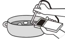
加熱の徹底と温度管理