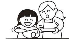
食事づくりへの参加