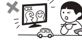
食事に集中できる環境づくり