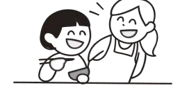
個々に合わせた声かけ