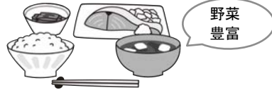
主食・主菜・副菜をそろえる

園では、子どもに必要な栄養を満たした食事を、食育の一部として計画的に提供しています。食経験の少ない子どもが無理なく、楽しく食べることができ、必要な栄養も摂取できるように、食材と調理法を選択しながら主食・主菜・副菜をそろえています。特に健康に欠かすことができないビタミン、ミネラル、食物繊維を多く含む「野菜」を積極的に取り入れています。また、将来の生活習慣病に配慮し、「減塩」「減糖」「減脂」を心がけ、健康的な食事で、しっかり栄養を摂取することを目指しています。