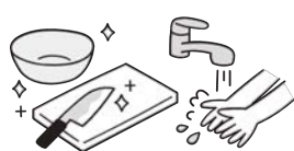
衛生的な調理環境の整備