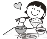
減塩・減糖・減脂でおいしく